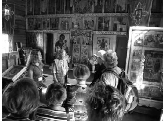
3. kuva. Ryhmäläisiä Kizin saarella erään kappelin sisällä. Saatiin kuunnella kolmen munkin sointuvaa laulua.