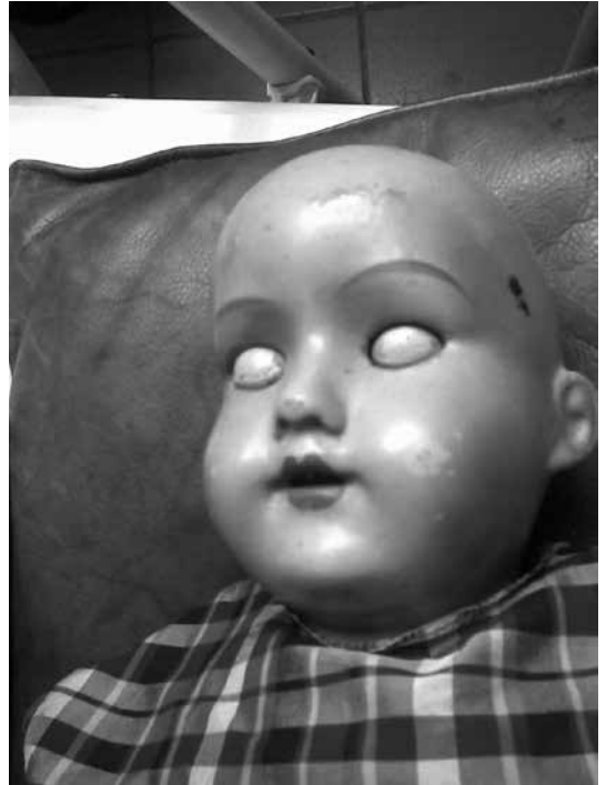
Hilikka -nukke ennen entisöintiä.